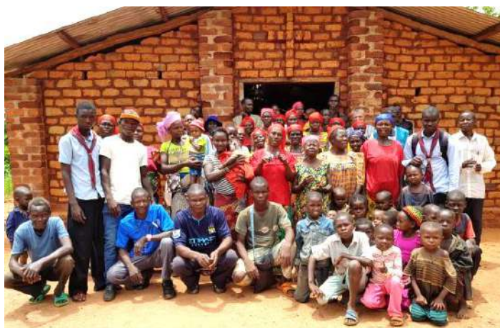
Groepsfoto met christelijke gemeenschap van Bandou na een misviering

Het werk dat onze medebroeders van Mobaye doen, is in de breedste zin des woords een werk van herijking en wederopbouw. In Mobaye is gebrek aan alles. Alles moet opnieuw opgebouwd worden. In deze wanhopige situatie zijn onze medebroeders, zonder voorop gezet plan, tekenen van hoop geworden. Zij zijn alles tegelijk: pastor, veldwerker, humanitair agent, opvoeder, gezondheidswerker en toevluchtshaven voor eenieder.