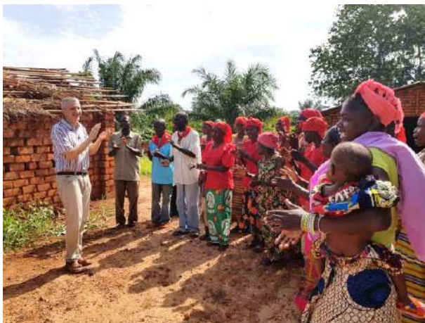
Warm welkom bij aankomst