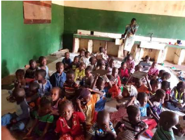
De kinderen van de kleuterschool van Sint-Jozef's Kerk