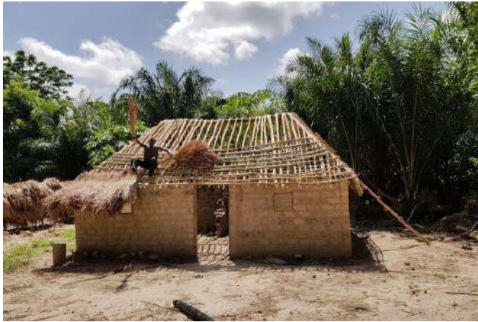
Een verwoest huis wordt herbouwd

geheel ongestraft hun verwoestend werk doen en terroriseerden geheel deze stad die in hun handen was gevallen.