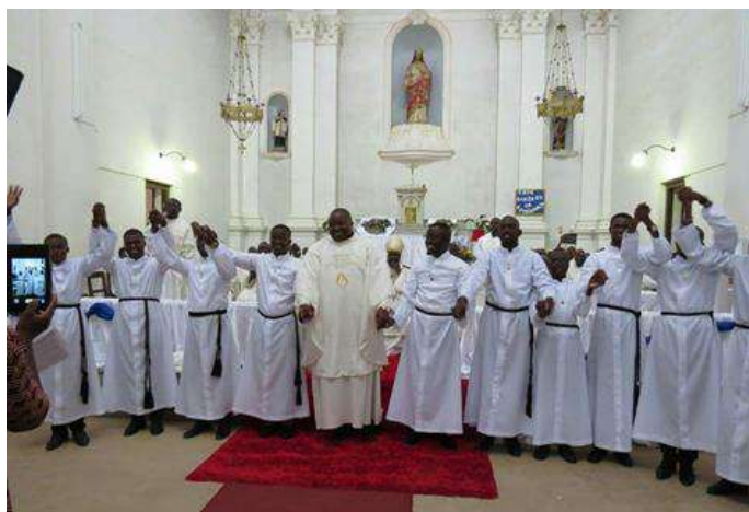
De nieuwste medebroeders 2017

De Katholieke Kerk in Angola is een onderdeel van de wereldwijde Rooms-Katholieke Kerk. Zo'n 56% van de totale bevolking is katholiek en circa 38% is protestant. Er is nog een klein percentage van andere 'kleine kerken'. De enige officieel niet toegestane religie is de Islam. De Katholieke Kerk in Angola is heel sterk groeiend. De parochies zijn steeds kleiner geworden, omdat steeds meer mensen naar de kerk gaan. Er zijn zeer veel vrouwelijke en mannelijke Congregaties. De Seminaries zijn er nog steeds vol, niet met jongeren die naar voedsel, geld of welstand zoeken, maar met jongeren die naar een andere levensstijl zoeken: een inspiratie. CSSp: (Congregatio Sancti Spiritus = Congregatie van de Heilige Geest). De spiritijnse missie in Angola bestaat sinds 14 maart 1866. Op die dag, 152 jaar geleden, zijn er de eerste