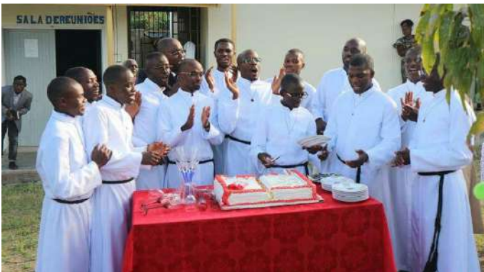
Noviciaat Angola 2017

Opleiding: Dit is een grote uitdaging voor de provincie en voor de Congregatie: “de toekomst voorbereiden”, want “ regeren is vooruitzien ”. De Angolese provincie besteedt hier veel aandacht aan en de vruchten hiervan zijn aanwijsbaar. Er zijn een klein- seminarie en twee groot- seminaries. Zoals overal verschilt de situatie van tijd tot tijd. Het aantal seminaristen is tussen 2003 en 2012 teruggelopen. Van 2013 tot 2018 is er een flinke stijging van het aantal