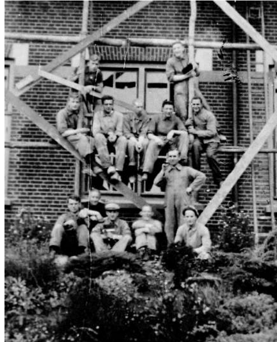
Fraters van Gemert helpen bij de wederopbouw van Gennep juli 1946

werden het land uitgejaagd of letterlijk over honderden kilometers eruit gedragen. Politiek ongewenst hetzij bij de nieuwe inlandse, communistisch georiënteerde regeringen, hetzij bij de tegenstanders van het nieuwe bewind. In Gennep wisselde men de wacht: de jonge oudstrijders vertrokken en talloze missionarissen die tot tien jaar hadden vastgezeten in Afrika kwamen terug "op vakantie". Oud-missionarissen die te zwak waren geworden voor de tropen of om politieke redenen niet konden terugkeren, volgden adaptatie-cursussen en gingen in Nederland, Duitsland of België deelnemen aan het pastoraat in de parochies. Ook in het dekenaat Gennep ontstond een nieuwe, vaste vorm van samenwerking met de diocesane clerus: de Spiritijnen namen nu ook parochies, kapelanieën en rectoraten aan in vaste dienst.