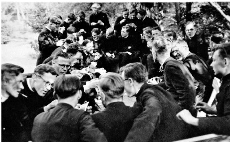
Picknick in Overloon 1959

Nu reeds meer dan zestig jaar bleven de togen, clergy-man of burgerkleding met een kruisje op de revers van de Spiritijnen samen met andere religieuzen en de diocesane geestelijkheid het katholieke beeld van het dekenaat in stand houden en - waar mogelijk - bevorderen.