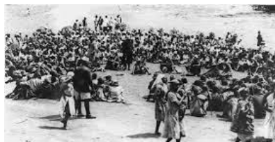
CLEANSING OF THE MAU MAU OATH AT NYERI 1953

In het begin van de jaren vijftig was het sociaal-politieke klimaat in Kenia naar een kookpunt gestegen. De radicale vleugel van de Kenya African Union nam haar toevlucht tot geweld en gewapend verzet, toen duidelijk werd dat de realisatie van een onafhankelijk Kenia niet via constitutionele middelen bereikt kon worden. Gevallen van moord, brandstichting en vee verminking die niet alleen gericht waren op witte kolonisten, maar ook op regeringsgetrouwe Kikuyu kwamen op zo’n grote schaal voor in de gebieden waar de Kikuyu woonden dat de regering daar haar gezag verloor. Missiescholen werden ook aangevallen. Daarom werd op 20 oktober 1952 door de koloniale regering de noodtoestand afgekondigd. De volgende dag werden Kenyatta en andere leiders van de Kenya African Union gearresteerd. De Mau Mau opstand brak in alle hevigheid los. Aanvankelijk hielden de twee kampen zich in evenwicht op het strijdtoneel, maar in het begin van 1954 kregen de veiligheidstroepen de overhand. De guerrillastrijders werden in toenemende mate geïsoleerd door de concentratie van de Kikuyu-bevolking in grote versterkte en gecontroleerde dorpen. Bovendien werden zij uitgeput door de bombardementen op hun kampementen. Na de gevangenneming van ‘maarschalk’ Dedan Kimathi in oktober 1956 werden de militaire operaties zo goed als gestaakt.