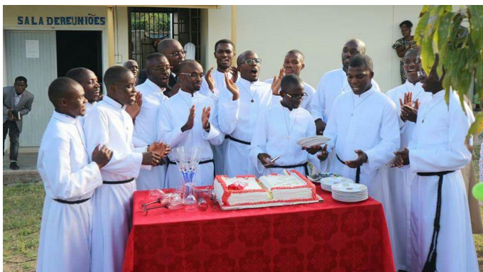
Noviciaat Angola 2017

Opleiding: Dit is een grote uitdaging voor de provincie en voor de Congregatie: “de toekomst voorbereiden”, want “ regeren is vooruitzien ”. De Angolese provincie besteedt hier veel aandacht aan en de vruchten hiervan zijn aanwijsbaar. Er zijn een klein- seminarie en twee groot- seminaries. Zoals overal verschilt de situatie van tijd tot tijd. Het aantal seminaristen is tussen 2003 en 2012 teruggelopen. Van 2013 tot 2018 is er een flinke stijging van het aantal