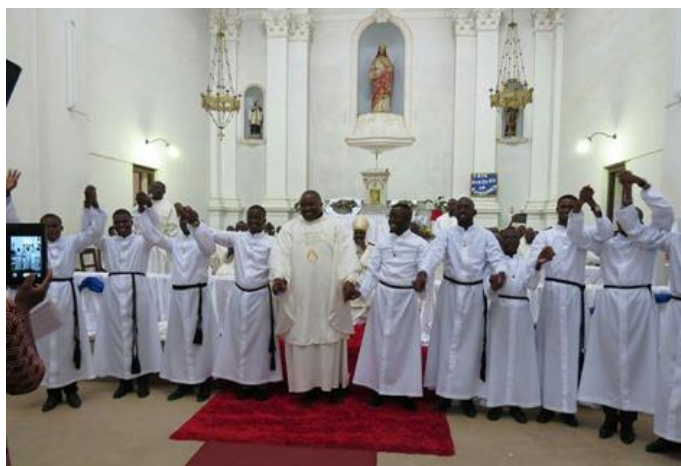
De nieuwste medebroeders 2017

De Katholieke Kerk in Angola is een onderdeel van de wereldwijde Rooms-Katholieke Kerk. Zo'n 56% van de totale bevolking is katholiek en circa 38% is protestant. Er is nog een klein percentage van andere 'kleine kerken'. De enige officieel niet toegestane religie is de Islam. De Katholieke Kerk in Angola is heel sterk groeiend. De parochies zijn steeds kleiner geworden, omdat steeds meer mensen naar de kerk gaan. Er zijn zeer veel vrouwelijke en mannelijke Congregaties. De Seminaries zijn er nog steeds vol, niet met jongeren die naar voedsel, geld of welstand zoeken, maar met jongeren die naar een andere levensstijl zoeken: een inspiratie. CSSp: (Congregatio Sancti Spiritus = Congregatie van de Heilige Geest). De spiritijnse missie in Angola bestaat sinds 14 maart 1866. Op die dag, 152 jaar geleden, zijn er de eerste